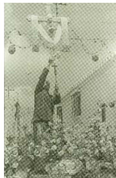
Exaltación de la Sta. Cruz.

En principio, la cruz iba rotando por las salas-habitaciones, de los bartolos (hermanos), hasta su ubicación definitiva en capillas.