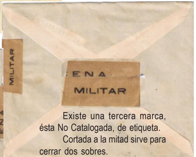
Existe una tercera marca, ésta No Catalogada, de etiqueta. Cortada a la mitad sirve para cerrar dos sobres.