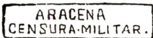
A106.1 61 x 10 Color: Negro.

Sabemos de dos marcas para estampillar catalogadas por Heller (Ed. 2000) y una de etiqueta sin catalogar. En la primera de ellas se observa un punto separando Censura de Militar.