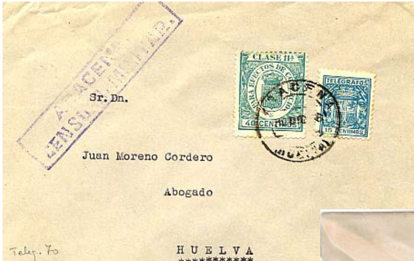
Carta con censura A 106.2 color Violeta y sellos fiscales (Especial Móvil y Para Efectos de Comercio) aprovechados postalmente.