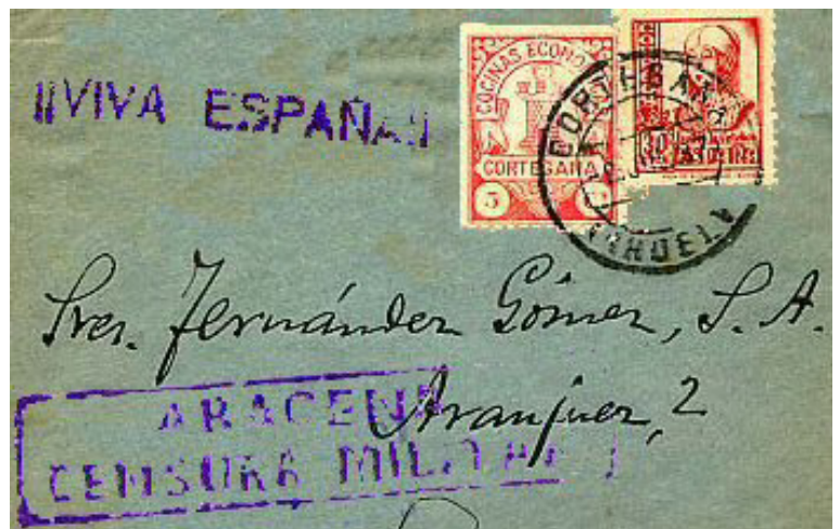
Fragmento de carta de Cortegana a Sevilla con Censura Militar de Aracena.