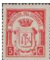
n° B101 5 C. rosa.