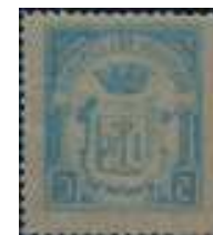
B102 calcado en reverso.