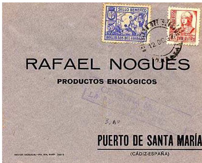
Carta con benéfico local B96.