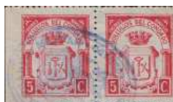
Con Marcas de la Comandancia Militar.