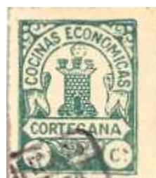
Litz-503 5 c.verde.

Curioso error, en verde, de Sol sin sus rayos: Reproducción para el Boletín Filatélico de San Sebastián.