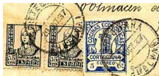
Fragmento con sello 241 de Cortegana.

Al igual que en otras poblaciones, se procede a tachar CORREO con tinta.