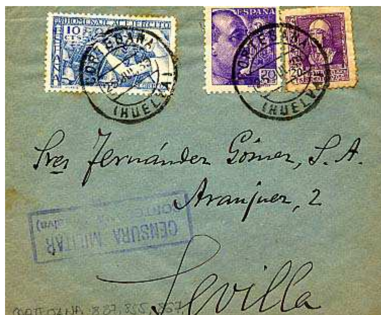
Carta de Cortegana a Sevilla con Censura Militar C127.3

C127.3 Medidas: 53 x 18 Color: Violeta o azul.