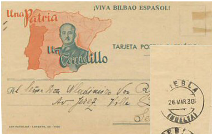
Postal a Sevilla con benéficos locales utilizados como franqueo.

También utiliza en su correspondencia benéficos de Huelva.