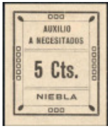
521 sin dentar.

Como habitualmente sucede en este tipo de sellos, es difícil no encontrarse con algún tipo de error o variedad; en este caso, conocemos los que presentamos a continuación: