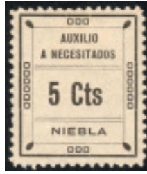
521, Cts sin punto.