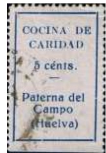
N de COCINA más pequeña.