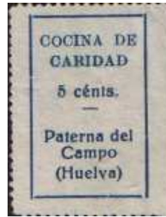
O de COCINA más pequeña.