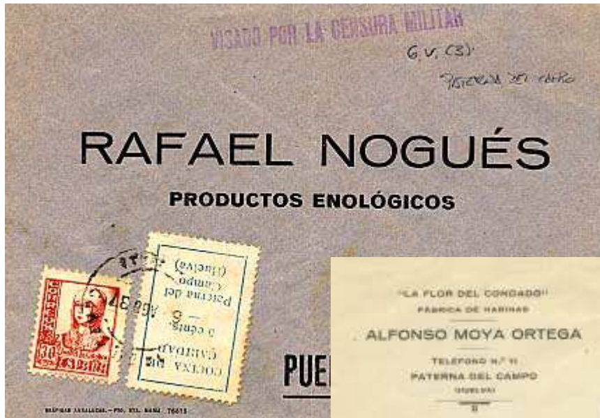
Carta de Paterna del Campo al Puerto de santa María con benéfico local 546a y Censura Militar de la Pal- ma del Condado.