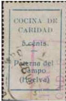
1ª A de CARI- DAD pequeña.