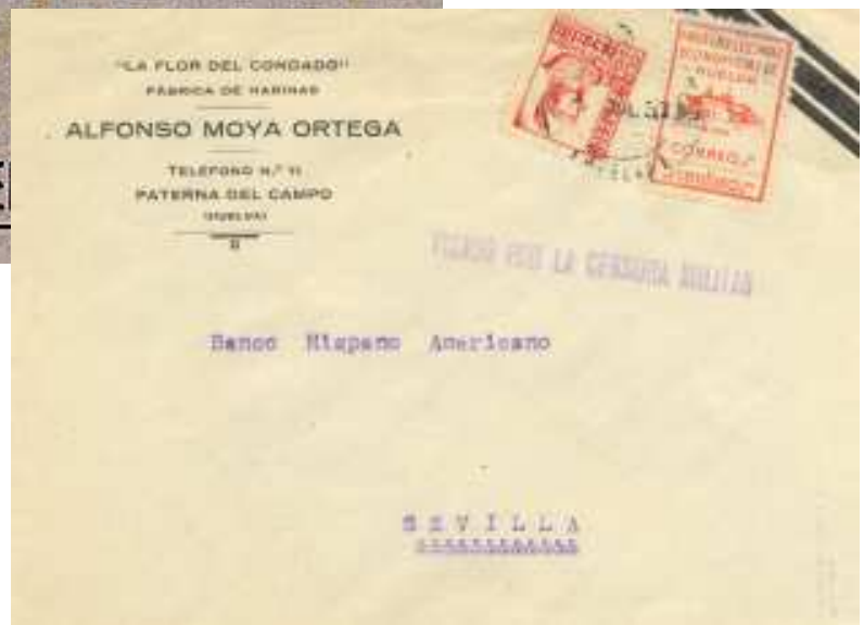
Idéntica carta a Sevilla pero con benéfico de la capital.