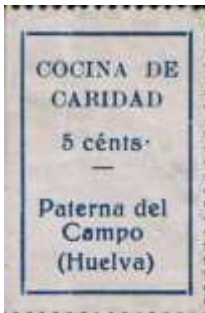
Punto de Cént. muy alto.