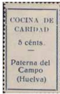
2ª A de CARIDAD pequeña.