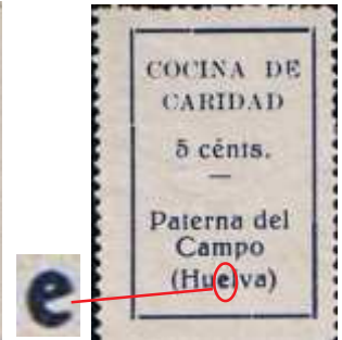
e muy remarcada.