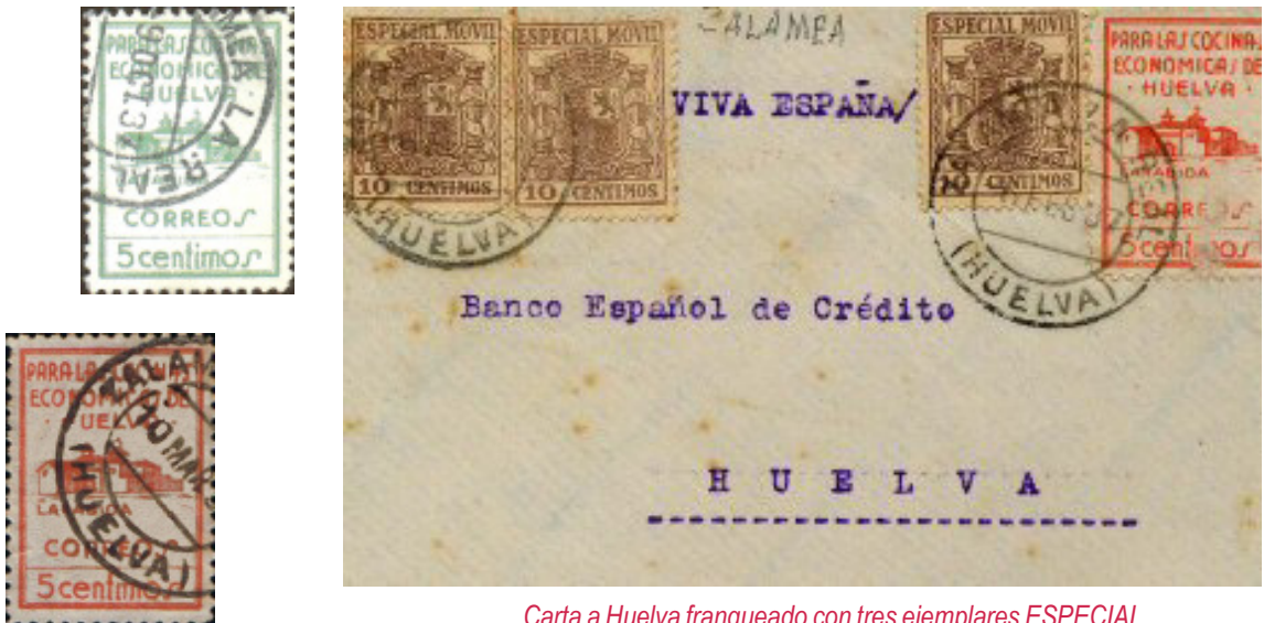
Carta a Huelva franqueado con tres ejemplares ESPECIAL MÓVIL de 1932 y benéfico 330 de Huelva.

Desde diciembre de 1936 y hasta mayo de 1937 aprovecha los comprados a la Junta de Auxilio a Necesitados de la capital.