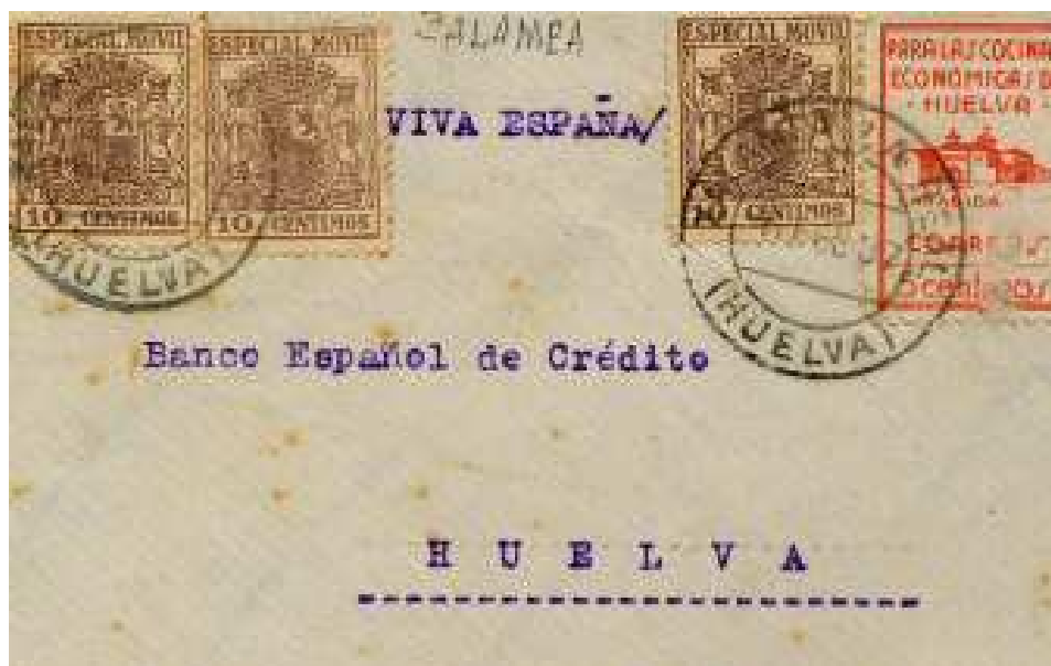
Carta a Huelva con benéfico 330 de Huelva.

Y también utiliza en su correspondencia, como es normal en la provincia, los sellos de Huelva capital.