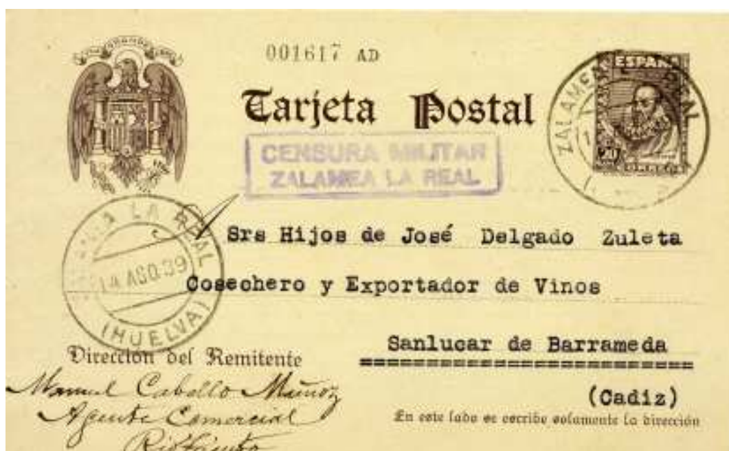
Tarjeta Postal con Censura Militar de Zalamea la Real.

Z5.1 Medidas: 48 x 12 Color: Violeta o Negra.